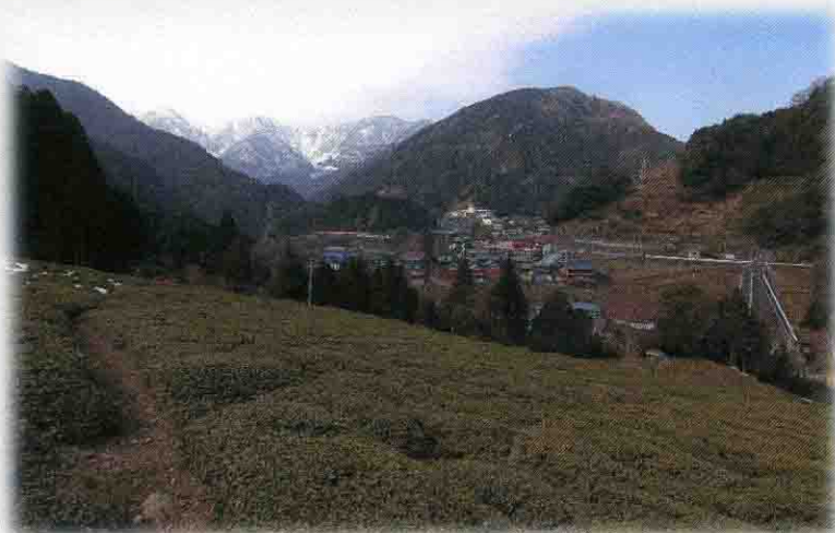
無農薬で栽培される春日茶