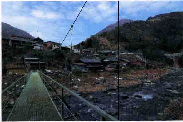
清流「粕川」と吊り橋

山の斜面に広がる茶畑は、昼夜の温度差が大きく厳しい気候風土の中でお茶の新芽が育ちます。